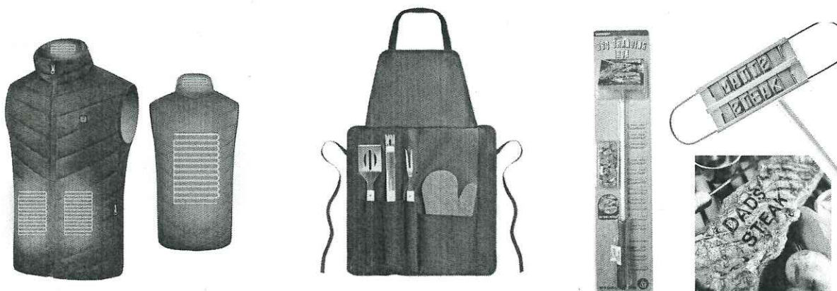
Kit de „Vreme rea” (vestă cu încălzire, set ustensile și șorț, ștanțator mesaj carne)

*Imaginile premiilor sunt cu titlu informativ