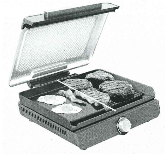
Grătar electric de interior