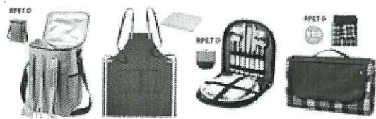
Kit SuperChef din plastic reciclat